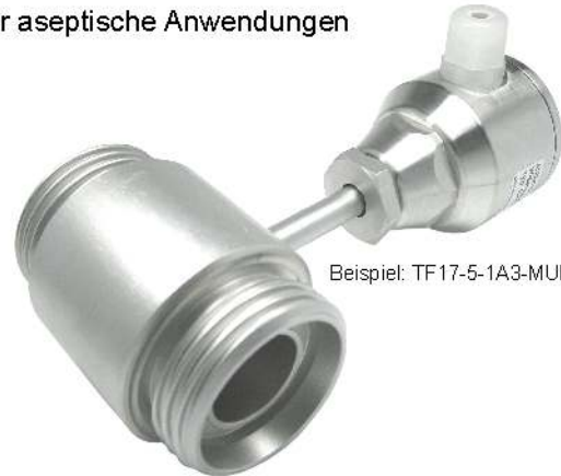
Beispiel: TF 17-5-1A3-MUK-A