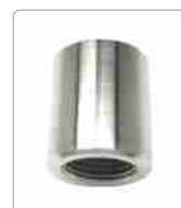
BP 15 (HPC-Sleeve No. 2)